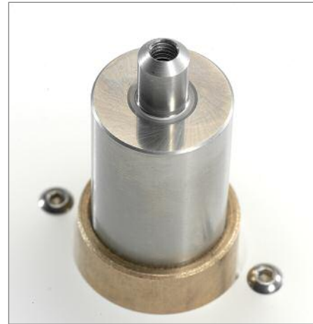
... im Vergleich zu den größeren Brüdern aus

Tonträgerjagd in der nächsten Großstadt. Heute nimmt einem der in jedem PKW obligatorische CD-Player diese kleinen Höhepunkte des Alltags. Oder kann sich noch jemand von Ihnen entsinnen, mit feuchten Händen zur Tür hereinzukommen und die letzten Meter bis zum ersten Ton zu zelebrieren, anstatt Musik wie Fast Food im Vorüberlaufen zu konsumieren? Wie wäre es, sich einfach mal die Zeit zu nehmen. Ein einleitendes Ritual zu Beginn, der Vorgang des Plattenaussuchens und -auflegens, reguliert das Anspannungsniveau nach unten. Das „in die Hand nehmen können“, das physische Erlebnis, die Platte aus der Hülle gleiten zu lassen, ist etwas anderes, als bei Foobar auf Play zu klicken. Das satte Gefühl des massiven Plattengewichts beim Aufsetzen auf den Dorn kann kein noch so hippestes und lifestylemäßig überhöhtes Mac-Book ersetzen. Noch mal einatmen, denn der Arm erfordert auch bei einiger Gewöhnung ein gewisses Maß an Fingerspitzengefühl, die Nadel absenken, und erst nach sauberem Einrasten in der Rille den passenden Eingang am Amp freigegeben. Es verblüfft mich täglich, in welchem Maß die gesamte Musikwiedergabe an Informationen und Details gewinnt. Musik lässt sich eben doch nicht in Abstrakten und Algorithmen aufdröseln. Diese aktive Beschäftigung mit meinem Cellisten ändert auch die eigene Einstellung zur Musik: Sie gewinnt ihre Würde zurück.