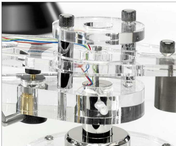
Auf die Spitze getrieben. Auch beim Cantus wird ein reibungsarmes Lager stabilisiert durch tiefen Schwerpunkt