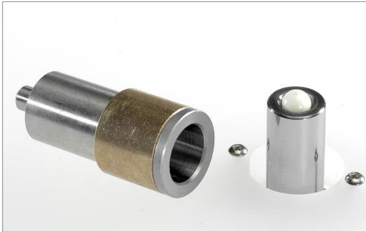
Die Bronzhülse gleicht das Einbaumaß des Tellers ...